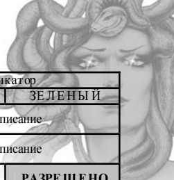
ТАБЛИЦА ПРОГРАММИРУЕМЫХ НАСТРОЕК СИСТЕМЫ